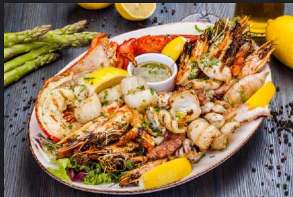
2.3.2. Morski plodovi

2.3.1. dnevne potrebe cinka u ljudskom organizmu izražene u miligramima