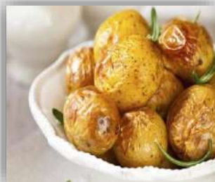
KRUMPIR U LJUSCI